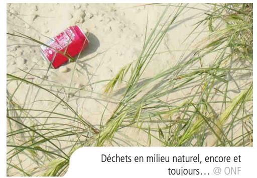
Déchets en milieu naturel, encore et toujours...

Les forêts de la région des Pays de la Loire accueillent chaque année des milliers de personnes en quête de nature. En forêts littorales ou en forêts de plaine, l'ONF veille à ce que ces visites se passent au mieux pour les usagers comme pour les sites traversés.